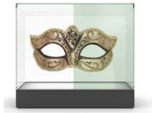
Floatglas entspiegelt herkömmliches Floatglas